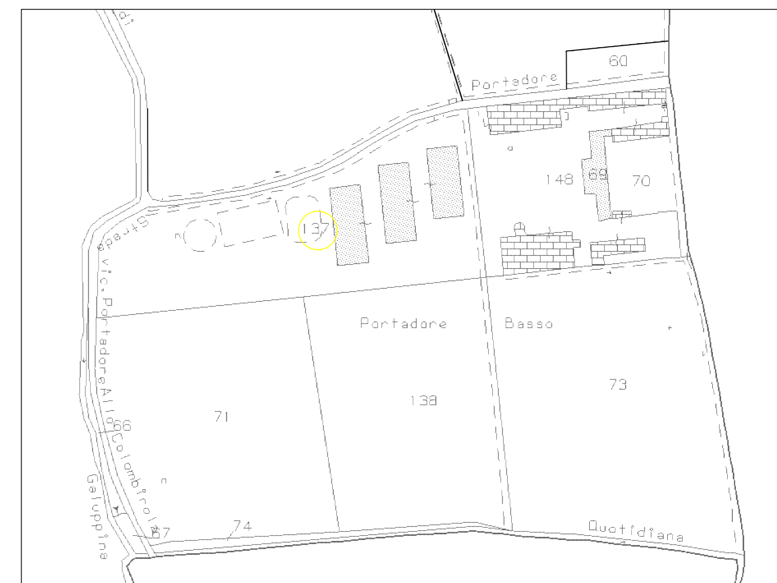
Estratto mappa catastale - scala 1:2.000