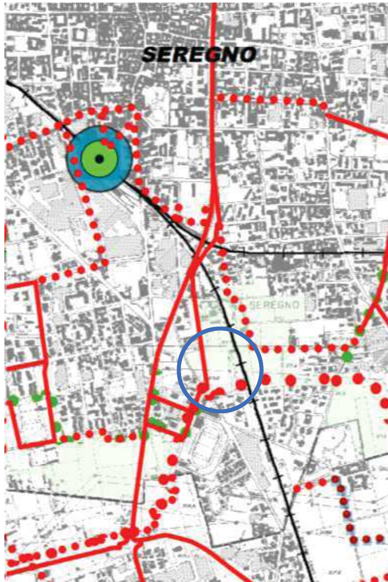
Piano strategico provinciale della mobilità ciclistica Estratto Tav.3 - Rete ciclabile comunale e sistema di trasporto pubblico